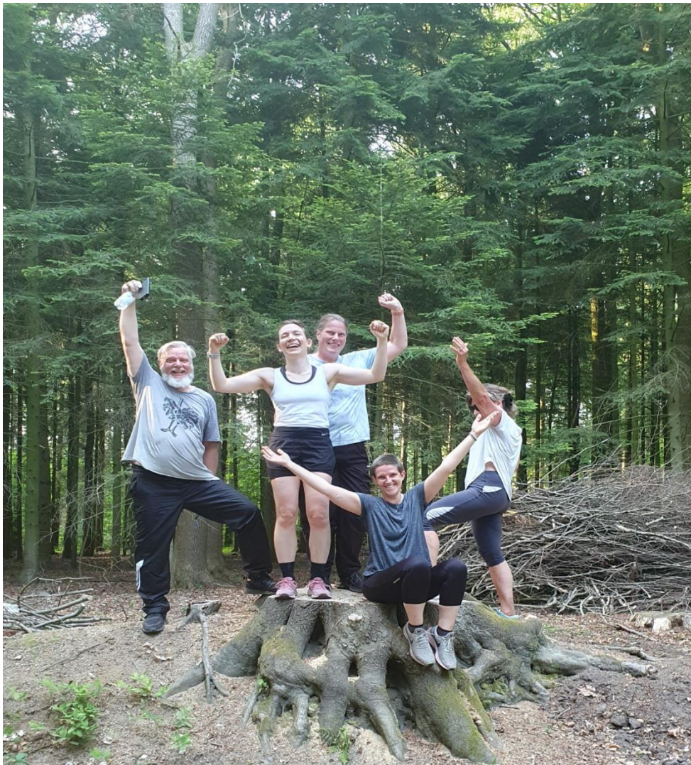
Foto aus dem letzten Jahr beim summer work out