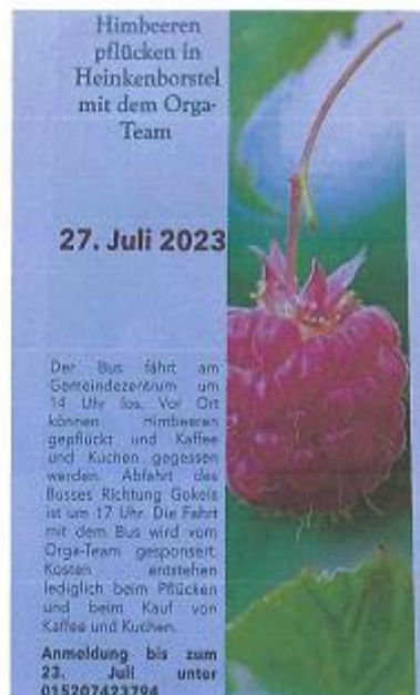
Flyer: Blitzaktion Himbeerpflücken